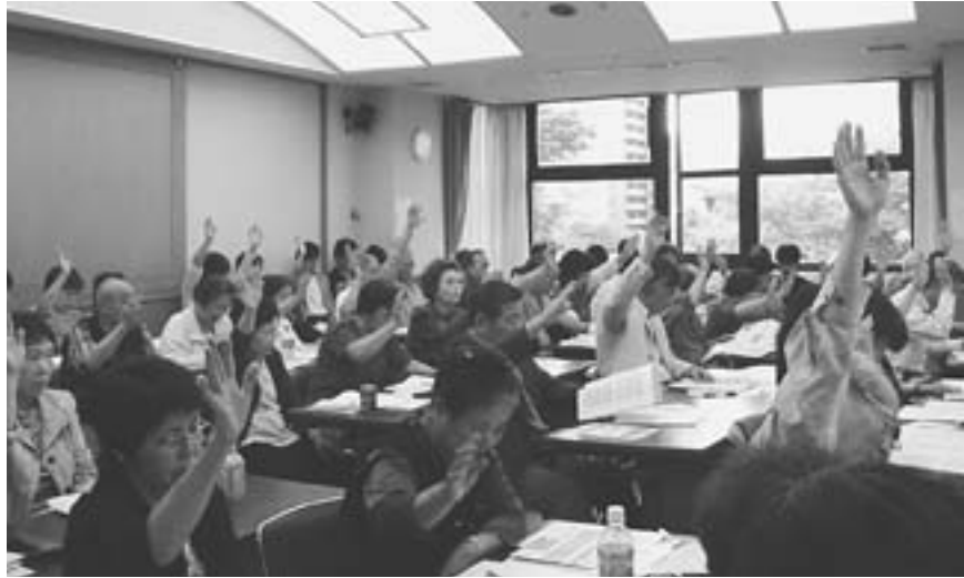
各議案は満場一致で採択されました

発行責任者 川尻克彦 編集責任者 組織委員会 発行所 目黒医療生活協同組合 東京都目黒区上目黒4-4-21 TEL 3716-2258