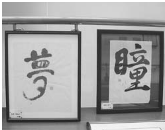
総代会会場に展示された書道作品