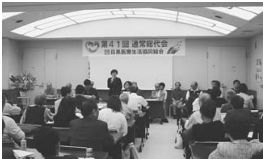
地域に役立つ頼りになる医療生協をつくりましょう