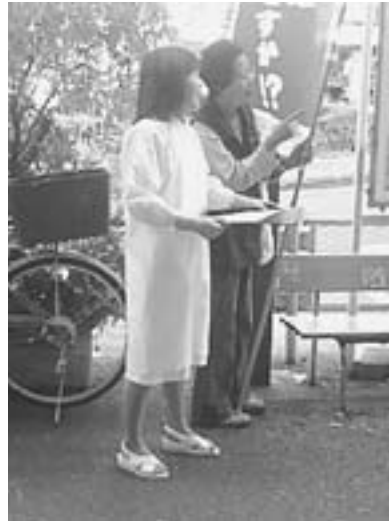
区民に廃止署名を訴えました #&

のた 本 目黒 区民に ので 本 目黒 区民に のた 本 目黒 区民に のた 本 目黒 区民に のた 本 目黒 区民に