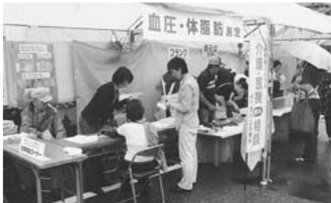
西小山方面の2会場の様子です